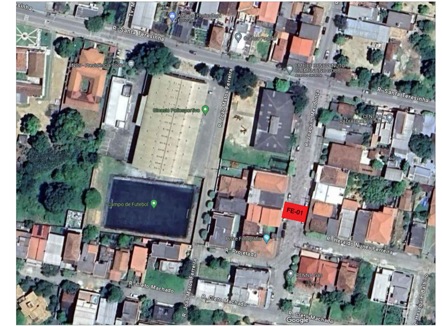
PLANTA BAIXA - FAIXA ELEVADA RUA JOAQUIM MENDONÇA FE-01 ESCALA: 1/250