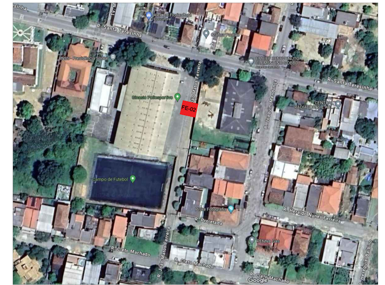
PLANTA BAIXA - FAIXA ELEVADA FE - 02 RUA JOÃO MATOS FERREIRA ESCALA: 1/250