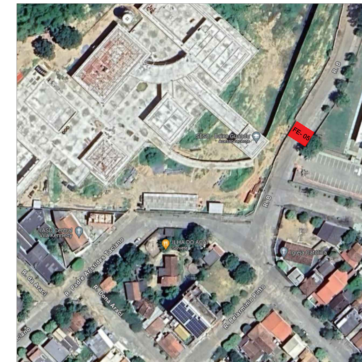
PLANTA BAIXA - FAIXA ELEVADA FE - 05 RUA WALTERLAN ALVES ESCALA: 1/250