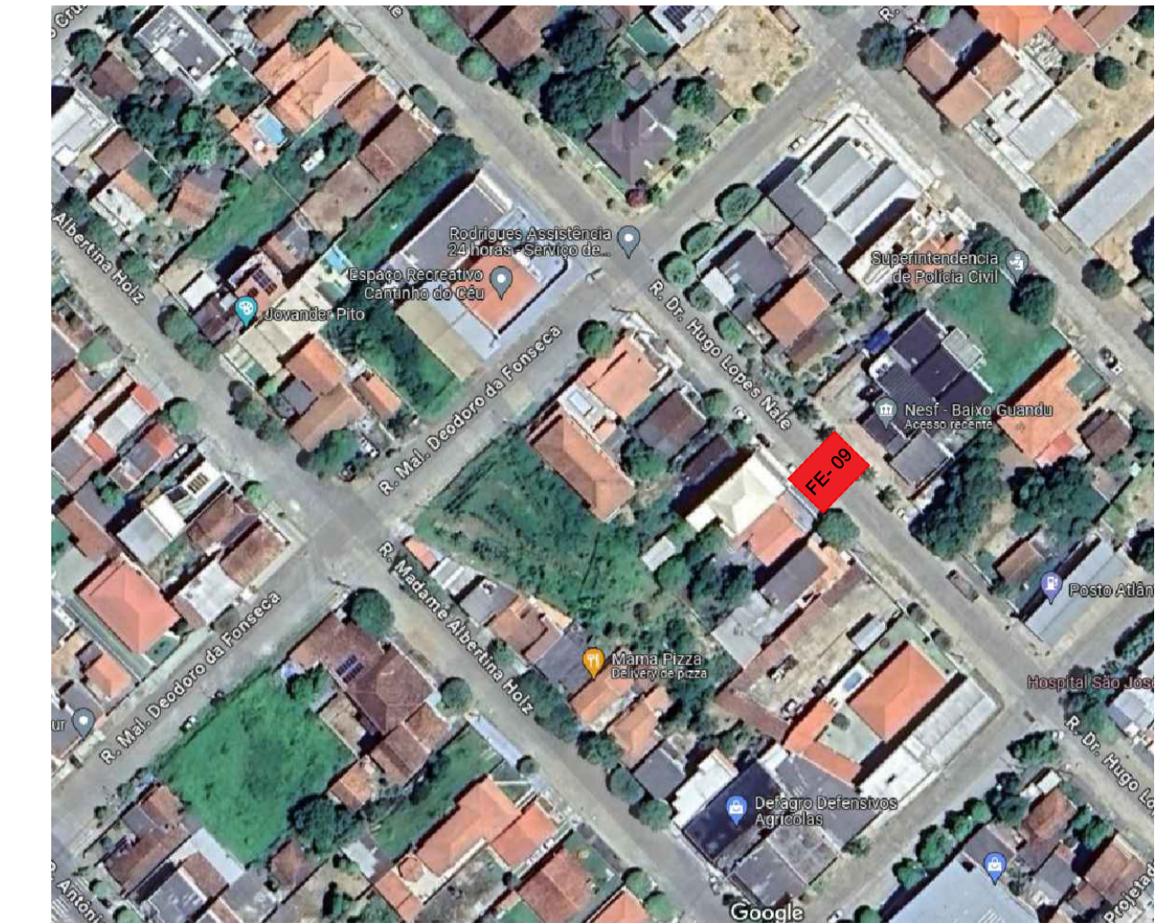
PLANTA BAIXA - FAIXA ELEVADA FE - 09 - RUA DR. HUGO LOPES NALLE (PRÓXIMO AO NESF) ESCALA: 1/250