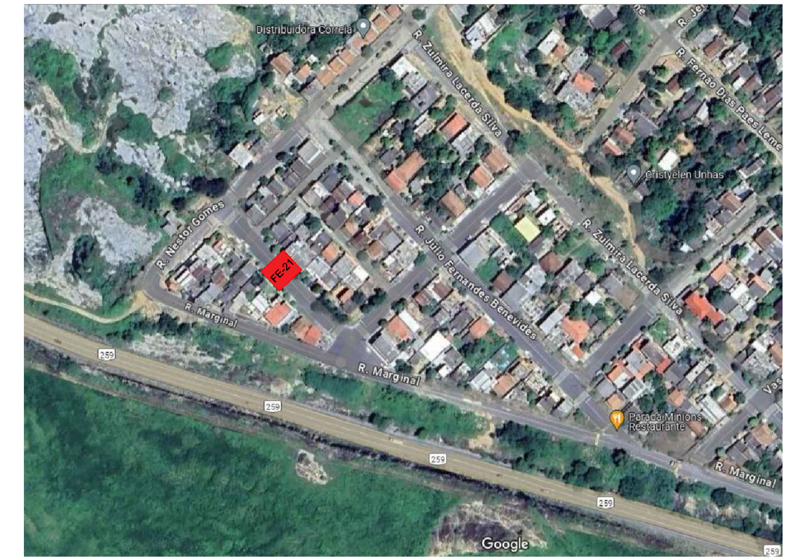
PLANTA BAIXA - FAIXA ELEVADA FE - 21 RUA ARIENIO DE ALMEIDA SANTOS ESCALA: 1/250